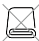
連泊時の清掃制限 Limited Cleaning for consecutive stay