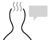
体調不良の場合は すぐにスタッフにお申し出ください If you are sick, please let the staff know immediately.

※発熱の症状など体調が優れないお客様は、お近くのスタッフまでお知らせください。 また、検温の結果体温が37.5度以上の場合など症状次第によっては保健所へ指導に則り対応させていただきます。