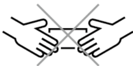
会計時における直接手渡し の中止 No Direct Hand-Over at the time of Paying Bill