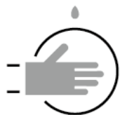
食材を扱う際の手袋着用 Wearing Gloves When Handling Food