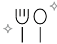
トレー・カトラリーのアルコール消毒 Alcohol Sterilization of Tray and Cutlery