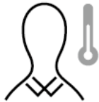
スタッフの体調管理 Staff's Health Care

当ホテルでは新型コロナウイルス感染症への対策の一環として、お客様と従業員の安全と健康を最優先に考え、以下の取り組みを実施しております。