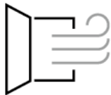
館内の換気 Ventilation in the Building