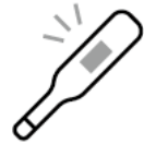
チェックイン時の検温 Temperature Inspection